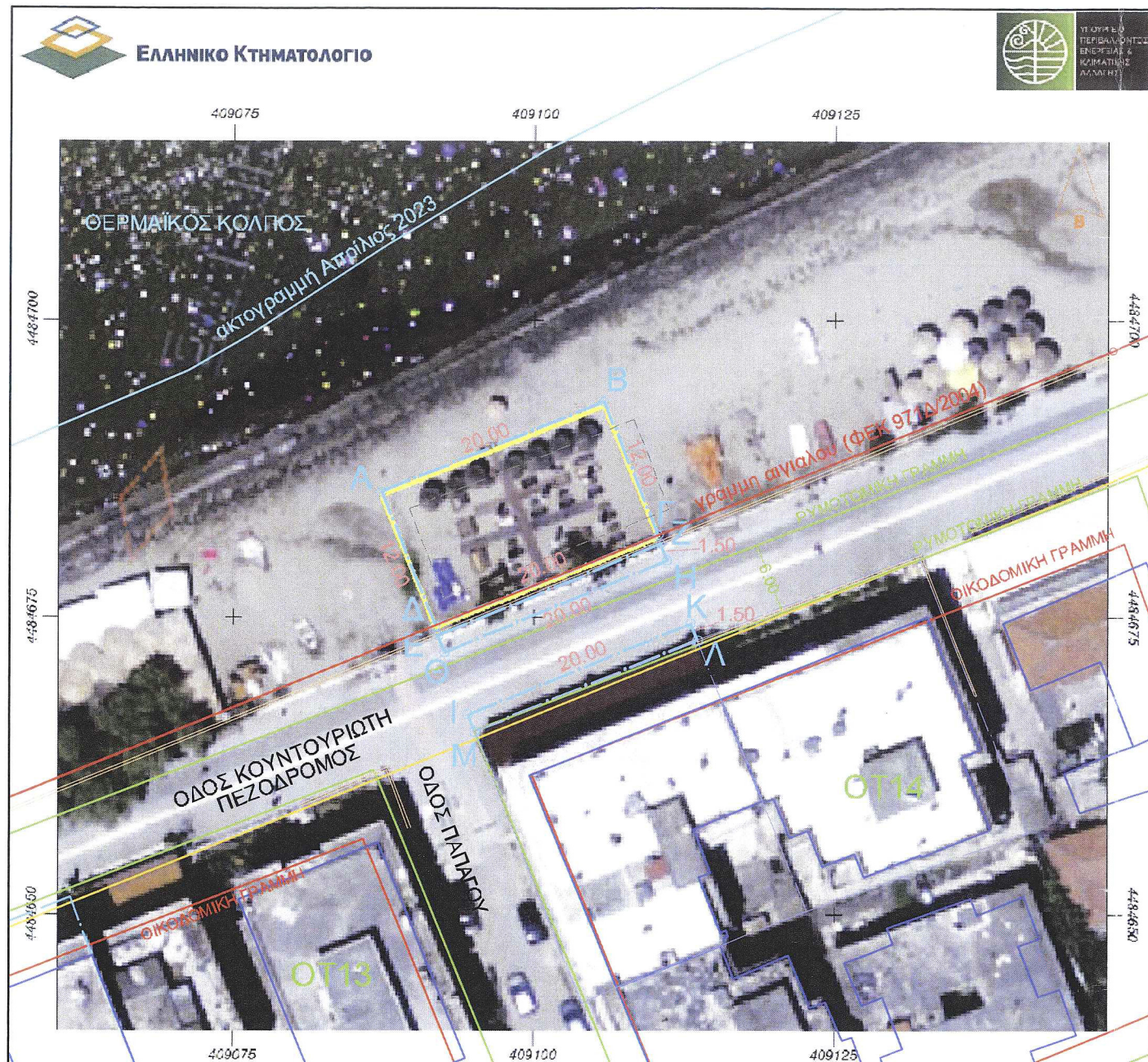
ΠΙΝΑΚΑΣ ΣΥΝΤΕΤΑΓΜΕΝΩΝ ΘΕΣΗΣ ΜΙΣΘΩΣΗΣ ΤΜΗΜΑΤΟΣ ΑΙΓΙΑΛΟΥ ΣΤΟ ΓΕΩΔΑΙΤΙΚΟ ΣΥΣΤΗΜΑ ΕΓΣΑ 87