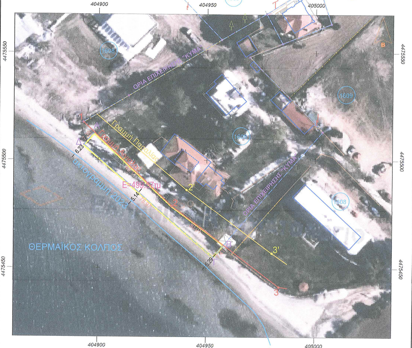
ΠΙΝΑΚΑΣ ΣΥΝΤΕΤΑΓΜΕΝΩΝ ΘΕΣΗΣ ΜΙΣΘΩΣΗΣ ΣΤΟ ΓΕΩΔΑΙΤΙΚΟ ΣΥΣΤΗΜΑ ΕΓΣΑ 87