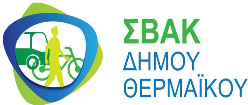
Σχήμα 2.2 Λογότυπο του ΣΒΑΚ του Δήμου Θερμαϊκού

Τέλος, η ομάδα έργου σε συνεργασία με τον φορέα εκπόνησης δημιουργεί το λογότυπο του ΣΒΑΚ του Δήμου Θερμαϊκού, το οποίο θα συνοδεύει από εδώ και στο εξής το σύνολο των εγγράφων του ΣΒΑΚ (Σχήμα 2.2).